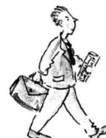
Ir para o trabalho